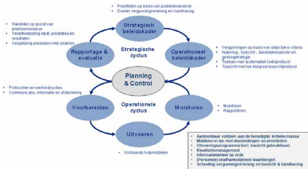
Figuur 1: de gesloten beleids- en uitvoeringscyclus conform de BIG 8

Centraal bij de gesloten beleidscyclus staan: